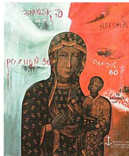
Matka Boża Solidarności

szy z obrazów przekazali podczas II Pielgrzymki Ludzi Pracy na Jasną Górę w 1984 r. jako symbol spotkań u stóp Czarnej Madonny. W obawie przed represjami ze strony SB, przewieziono go pod osłoną innego obrazu z wizerun-