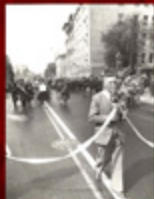
1. Zjazd milicji i policjantów z kłosa gromadzący uliczników w „Solidarności” przed wejściem do Zakładów Przemysłowych im. 1 Maja w Koszalinie.

skim. W październiku w Wyższej Szkole Inżynierskiej w Koszalinie powstał komitet założycielski Niezależnego Zrzeszenia Studentów. W listopadzie w stolicy województwa utworzono Komitet Wojewódzki „Solidarności Wiejskiej”. Nieco później, bo w marcu 1981 r. w mieście zaczął funkcjonować także komitet założycielski NSZZ „Solidarność Rzemieślników”.