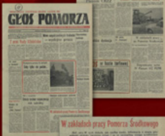
5. W Koszalinie znowu protest. Właściciele zakładu PKP w Koszalinie wstrzymali dostawy energii.