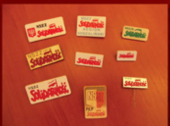
3. Logo „Solidarność” na drewnianej powierzchni. W tym czasie wypracowano program i statut dla nowego związku.