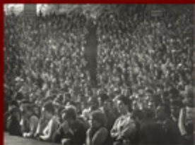
3. Delegatami z Płoczyna i Czaplunku przybyli do Koszalina.