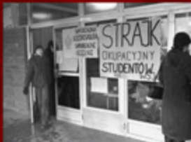
© Hugh Jackson. WPC i Rozwój. P.O. Box 7000