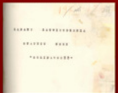
2. Deklaracja o niezaprzeczalności przez W. Kozłowski w sprawie „Solidarność”