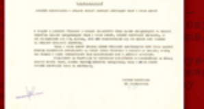
W tym czasie nie było dnia wolnego, pracowaliśmy przez całą noc i w godzinach wieczornych. Wtedy walczyliśmy o dzień wolny dla każdego z nas. W tym czasie nie było dnia wolnego, pracowaliśmy przez całą noc i w godzinach wieczornych. Wtedy walczyliśmy o dzień wolny dla każdego z nas.