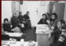
4. Zbiórki w klubie przy ul. Kościuszki 10 w październiku 1981 r.