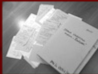
1. Dokumenty z akt sprawy obiektywnej „Związek” w archiwum SB w Koszalinie

dowych Komitetach Założycielskich działało trzech, w strukturach zakładowych związku zaś siedmiu tajnych współpracowników SB. W późniejszym okresie bezpieka starała się także wywoływać konflikty między działaczami „Solidarności”, przykładowo poprzez rozpowszechnianie plotek o kryminalnej przeszłości niektórych z nich.