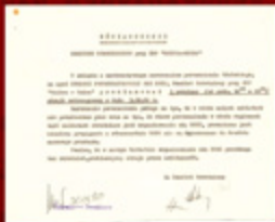
1. Dokumenty informujące o realizacji umów porozumiewawczych z „Solidarnością”

„Solidarności”, 29 września Krajowa Komisja Porozumiewawcza zapowiedziała na 3 października ogólnopolski, godzinny strajk ostrzegawczy. W województwie koszalińskim stanęło tego dnia 45 zakładów. Pracę przeważało przeszło 3 tys. osób.