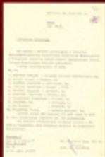
19. Dokument powołujący do życia nowy związek zawodowy w Koszalinie.