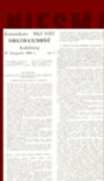
3. Strona tytułowa pierwszego numeru „Solidarności”