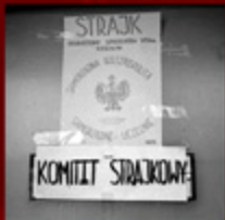
© Hugh Jackson. WPC i Rozwój. P.O. Box 7000

nego strajku ostrzegawczego, jeśli sejm udzieli rządowi specjalnych uprawnień oraz strajk powszechny w przypadku zastosowania przez rząd środków nadzwyczajnych. Do „minimalnych warunków” postawionych przed władzami przez „Solidarność” do zawarcia porozumienia narodowego należało ustanowienie związkowej kontroli nad gospodarką (w tym przede wszystkim zasobami żywności), przeprowadzenie demokratycznych wyborów do rad narodowych, przyznanie Społecznej Radzie Gospodarki Narodowej (jej powołanie było częścią programu związku przyjętego na I KZD) wpływu na decyzje rządu oraz zapewnienie „Solidarności” dostępu do radia i telewizji.