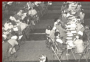
6. I Walne Zebranie Delegatów NSZZ „Solidarność” Regionu „Pobrzeże” w Koszalinie (12.06.1981 r.).