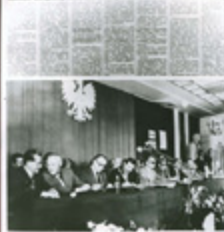
3. Podpisanie porozumienia zwaitego 8700 Katowic Krakowa (Województwo Śląskie) Strabawy w dniu 31 sierpnia 1980 roku w Szczecinie