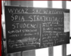
© Hugh Jackson. WPC i Rozwój. P.O. Box 7000