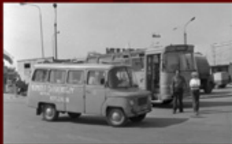
2. Wozokomunikacyjny.