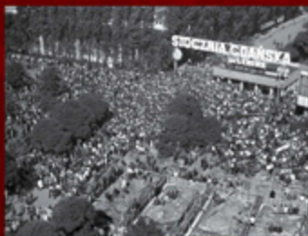
3. Strajk w Stoczni Gdańskiej, sierpień 1980 r.