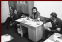
4. Zbiórki w klubie przy ul. Kościuszki 10 w październiku 1981 r.