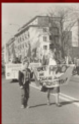
18. Międzyzakładowy Komitet Założycielski w Koszalinie.