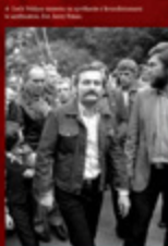
2. Lech Wałęsa spaceruje z delegatami z Koszalina w amfiteatrze (26.06.1981 r.).