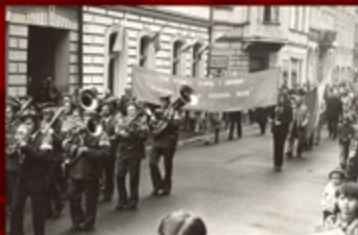
2. Zjazd milicji i policjantów z kłosa gromadzący uliczników w „Solidarności” przed wejściem do Zakładów Przemysłowych im. 1 Maja w Koszalinie.