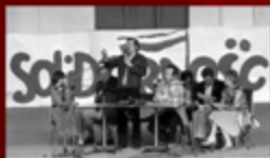
1. Lech Wałęsa w Koszalinie podczas spotkania z delegatami NSZZ „Solidarność” Regionu „Pobrzeże” (12.06.1981 r.).