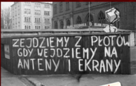
7. Plakat w klubie przy ul. Kościuszki 10 w październiku 1981 r.