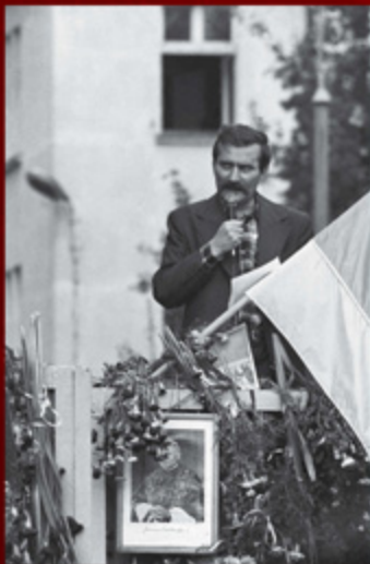
1. Lech Wałęsa przemawia na Chłostwie (Chłostkowo, Łódź), sierpień 1980 r.

W obu aglomeracjach utworzono Międzyzakładowe Komitety Strajkowe, do których akces zgłaszały kolejne przedsiębiorstwa z wybrzeża, ale także z innych części kraju. Choć główną przyczyną protestów była po raz kolejny zła sytuacja gospodarcza, postulaty o charakterze ekonomicznym poprzedzał jeden najważniejszy. Na pierwszym miejscu strajkujący żądali utworzenia nowych, niezależnych od władz i pracodawców związków zawodowych (wśród innych postulatów znalazło się także m.in. zniesienie cenzury, legalizacja prawa do strajku w konstytucji oraz zaprzestanie prześladowań działaczy opozycji). Skala protestów sprawiła, że komuniści zdecydowali się na podjęcie rozmów ze społeczeństwem.