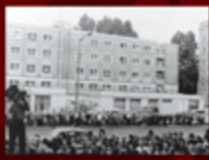
5. Złoty i srebrny jubileusz „Solidarność” w Warszawie, 10 listopada 1981 r. (zobacz: „Solidarność” w Warszawie, 1981, s. 10-11)