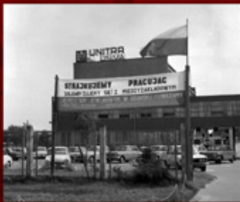
1. Strajk w Koszalinie. Zakład Przemysłu w Koszalinie.

zanych przedsiębiorstw w Białogardzie (komunikacja) i Szczecinku („Transbud”). W kolejnych dniach w województwie do protestów przystępowali pracownicy następnych zakładów pracy, w tym m.in. Zakładu Remontowo-Montażowego, Wojewódzkiej Spółdzielni Mleczarskiej, Zakładów Maszyn i Urządzeń Technologicznych „Unitra-Unima” – Zakładu Techniki Próżniowej i Wojewódzkiego Przedsiębiorstwa Komunikacji Samochodowej w Koszalinie, Polskiej Żeglugi Bałtyckiej w Kołobrzegu, Zakładów Podzespołów i Urządzeń Teletechnicznych „Telkom-Telcza” w Czaplinku, Przedsiębiorstwa Połowów i Usług Rybackich „Kuter” i Państwowych Zakładów Przemysłu Skórzanego „Alka” w Darłowie czy Zakładów Sprzętu Instalacyjnego „Polam” w Szczecinku.