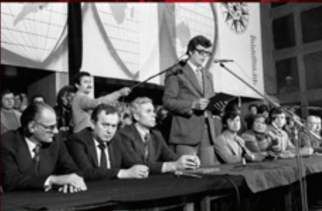
4. Podpisanie porozumienia zwaitego 8700 Katowic Krakowa (Województwo Śląskie) Strabawy w dniu 31 sierpnia 1980 roku w Szczecinie