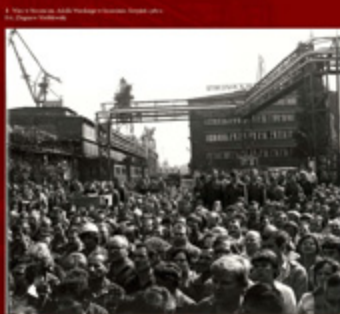
2. Władimir Łukin, Aleksandr Kozłow i Leonida Szepelowa, sierpień 1980 r.