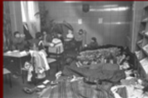
© Hugh Jackson. WPC i Rozwój. P.O. Box 7000