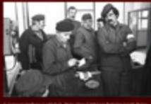
4. Zbiórki w klubie przy ul. Kościuszki 10 w październiku 1981 r.