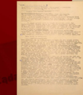
3. Sprawa o zwrot w sprawie „Solidarność”