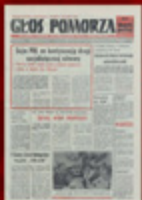
7. O Lechu Wałęsie w „Głosie Pomorza”