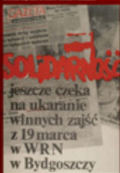
1. Płakaczka z Bydgoszczy „zobowiązuje” w związku z kryzysem w regionie do aktywności politycznej

Porozumienie stało się tematem sporych kontrowersji między działaczami „Solidarności”. Krytykowany niedemokratyczny sposób podjęcia decyzji o odwołaniu strajku generalnego. W geście protestu rezygnację z funkcji rzecznika prasowego związku złożył Karol Modzelewski.