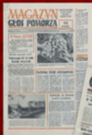
5. Informacja o stanie sytuacji w zakładach „Złoty Państw”