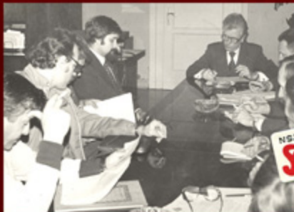
© Hugh Jackson. WPC i Rozwój. P.O. Box 7000